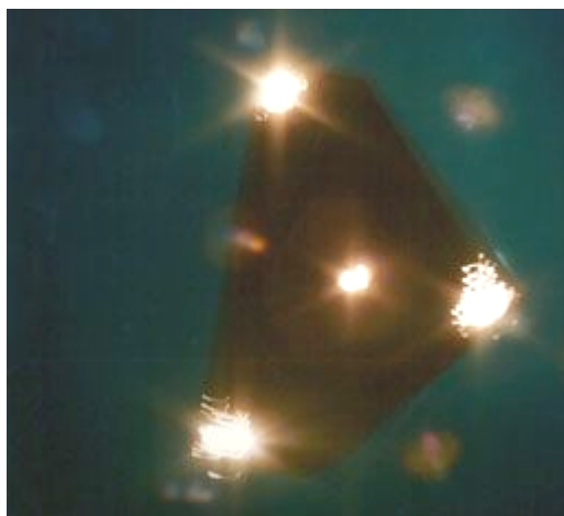
Een poging uit 1992 om de Petit-Rechain met eenvoudige middelen na te bootsen. Voor deze opname gebruikte de auteur een stuk blauwgrijs karton waarop een zwarte driehoek, ook in karton, werd gekleefd. In de hoeken van de driehoek werden vervolgens gaatjes geprikt waarachter lampen werden gezet.

Bij zijn analyse maakte Meessen gebruik van computerbewerkte foto's en analyses die door Prof. Marc Acheroy en enkele van zijn studenten aan de Koninklijke Militaire School waren gemaakt. Acheroy had ook een simulatiefoto die door ondergetekende met behulp van een geperforeerd stuk karton en enkele lampen was gefabriceerd, geanalyseerd. Hij was daarbij tot het besluit gekomen dat de foto uit Petit-Rechain nooit op die manier kon zijn vervalst. Aanbevelingen om i.p.v. een lamp achter een geperforeerd stuk karton te plaatsen en kleine lampjes aan de voorkant te bevestigen, werden in de wind geslagen. Het werkte nochtans perfect: om de rare lichtslangetjes te krijgen hoefde je het met lampjes uitgedoste karton slechts aan een touwtje op te hangen en er vervolgens een kleine tik tegen te geven.